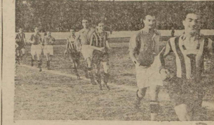
Fener ve Galatasaray takımları sahaya çıkarken

Oyun, şimdiki kadar rastlanılmayan bir şekilde heyecanlı ve güzel olarak cereyan etti