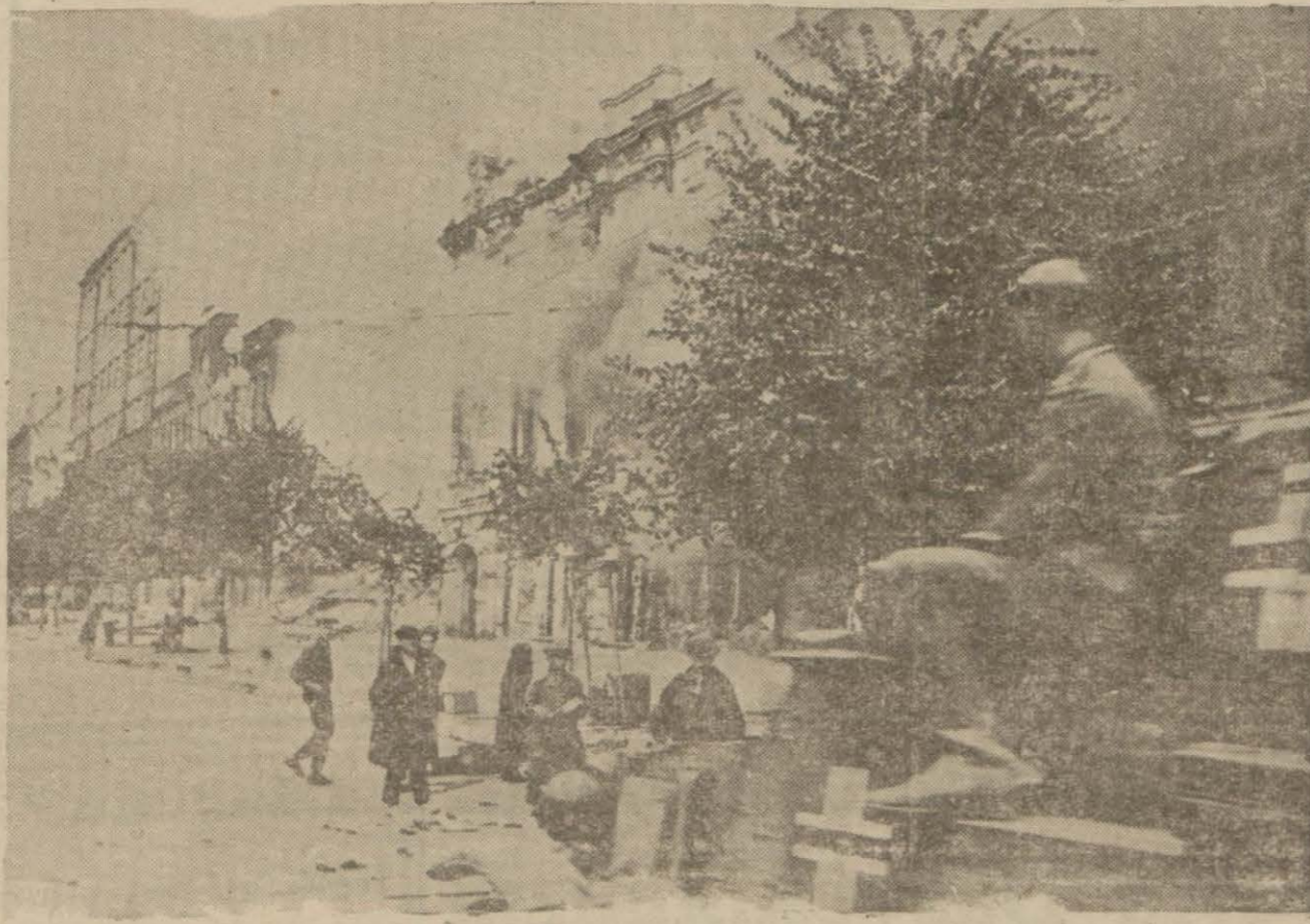
Ukraynada Almanlar tarafından işgal edilen bir Sovyet şehri

Ruzvelte İngiltere sefiri Lord Hall fakas refakat etmektedir.