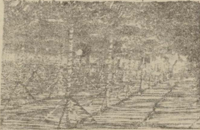
Fidanlıklarımızdan birinden bir görünüş